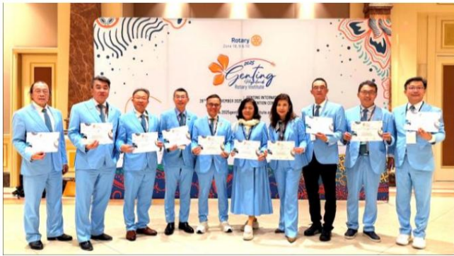
ジュンDGEはチームを率いて11月28日から30日までゲンティン・ロータリー・クラブのマレーシア2025スタディツアーに参加し、DGN Cardiacもこのイベントに参加しました。

第65回秋の旅は、第3248回モバイルミーティングと合わせて、11月28日と29日に基隆市暖東峡谷のLAPOPOキャンプ場で開催され、自然を満喫しました。翌朝は宜蘭の蘭陽博物館を訪れ、午後は三星郷の星宝葱農場で、環境に優しい葱畑を鑑賞したり、葱餅を手作りしたり、愛らしい動物たちと触れ合ったりしました。