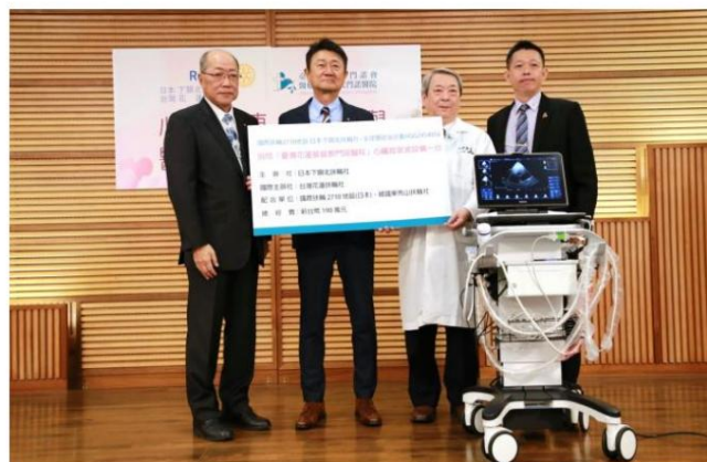
メノナイト病院に心臓超音波検査装置を寄贈(190万台台湾ドル)