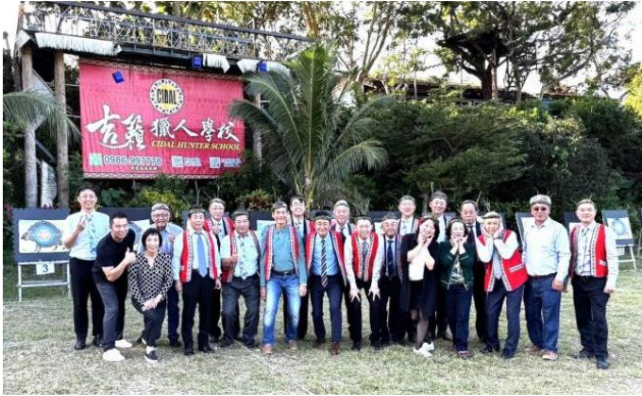
午後はリラックス～水蓮吉来獵師学校で先住民族と触れ合う アーチェリー、竹編み、ダンス