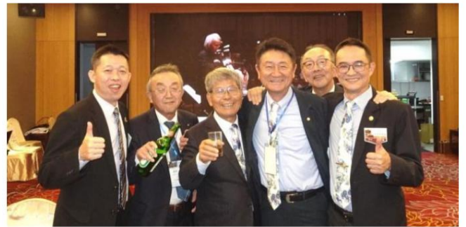
PP Highway では、ヌルホン最高品質の紹興酒 4 本をシェアして楽しみをさらに盛り上げます