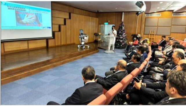
寄贈式後の循環器健康教育講演会