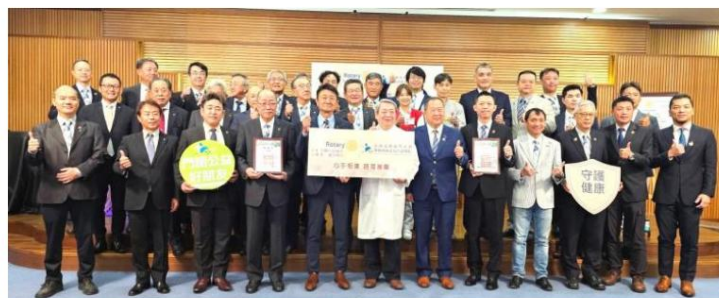
無事に寄贈式を終えました