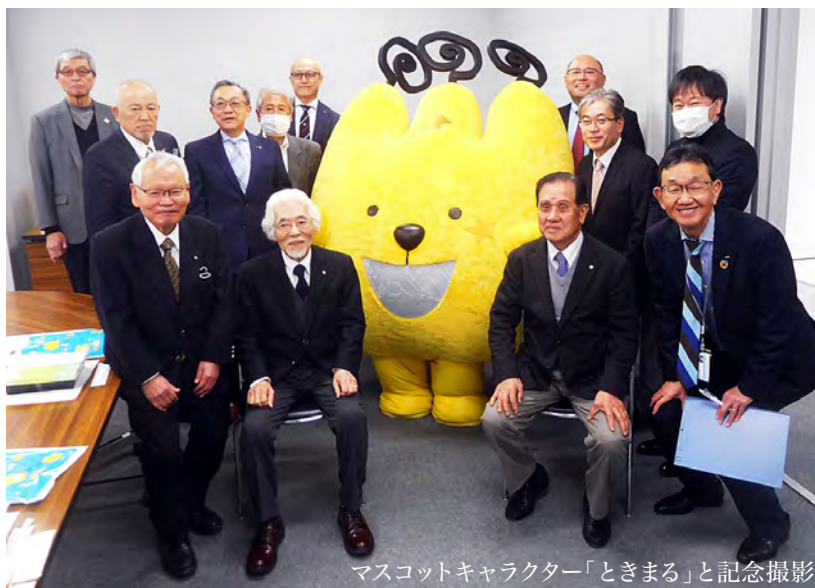
マスコットキャラクター「ときまる」と記念撮影