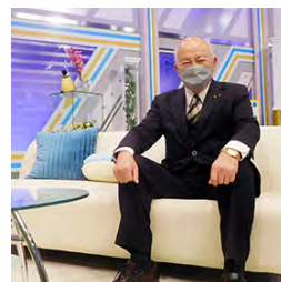
スタジオセットでキャスター気分。