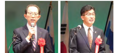
福島県知事 内堀雅雄様 福島市長 木幡 浩様