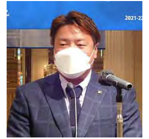
ヤクルト、大リーグ、楽天で活躍 2006年、2009年WBC日本代表として 2連覇に貢献。