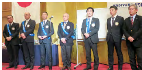
両クラブ新入会員紹介 どうぞよろしく!