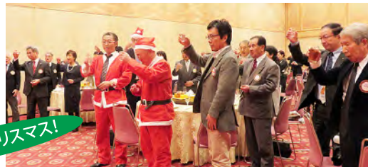
メリークリスマス!

郡山北RCの皆さんのご尽力に感謝申し上げます。今日は楽しく、好意と友情を深めましょう！