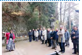
11月27日(会津) 飯盛山・白虎隊の墓・さざえ堂一末廣酒造・嘉永蔵 一七日町通り・渋川問屋-鶴ヶ城)一福島空港お見送り