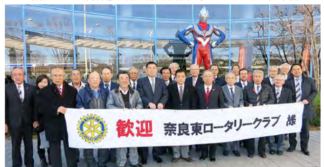
11月26日 福島空港お出迎え一なりた温泉うねめの里(片平町) 「王宮伊豆神社・山ノ井ノ清水・采女神社一三ヶ寺・岩蔵寺・常居寺一モーニング