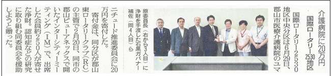
平成28年7月2日福島民友より(一部抜粋)