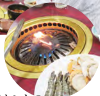
これがホントの ファイヤーサイド?