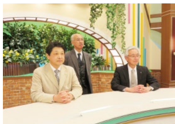
ついにキャスターデビュー?????

ふくしまスーパーJチャンネルのスタジオ、なかなか見ることができないスタジオに興味津々、楽しそうです。